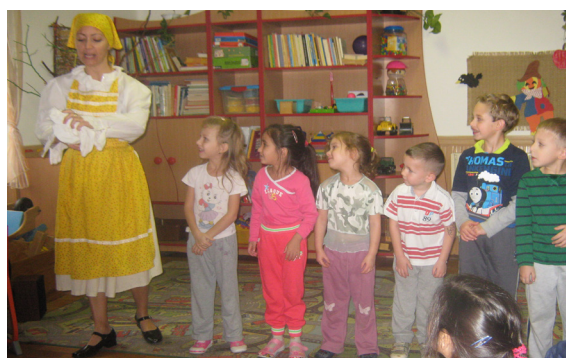
BABSZEM JANKÓ GYERMEKSZÍNHÁZ VÁRASZÓN