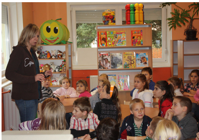
RENDRAGYÓ IRODALOMÓRA TARNAMÉRÁN