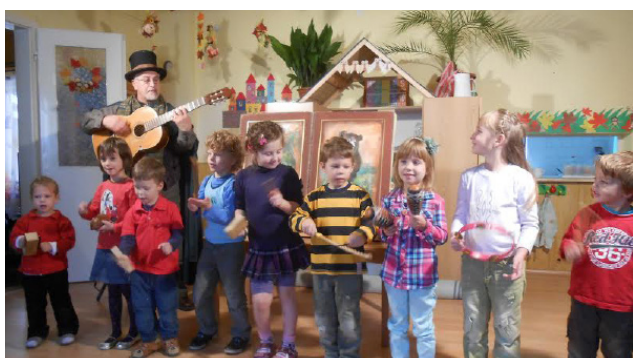
LÓCI SZÍNPAD NAGYKÖKÉNYESEN