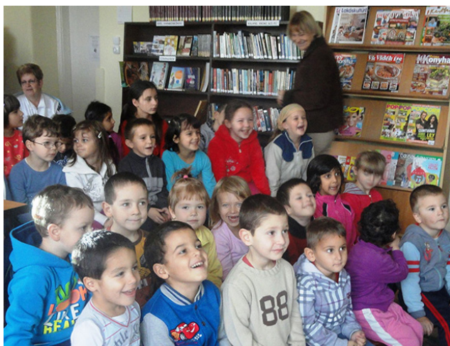
RENDRAGYÓ ÉNEKÓRA MIKÓFALVÁN